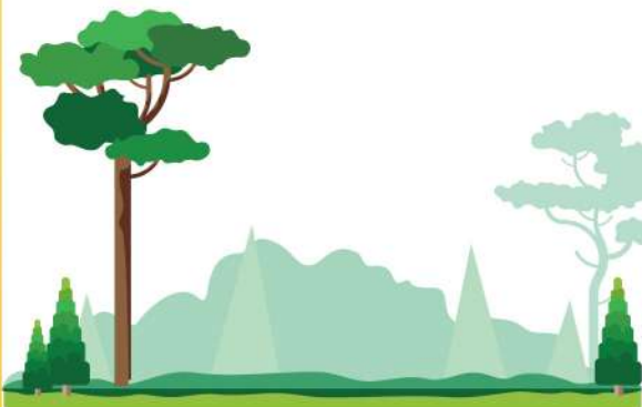
森 ㄙㄢˊ 林 ㄌㄩㄢˊ