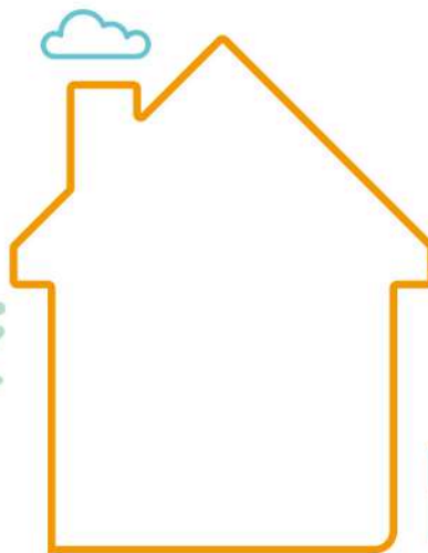
人 ㄖㄣˊ 類 ㄌㄟˊ 的 ㄉㄜˊ 家 ㄐㄞˊ