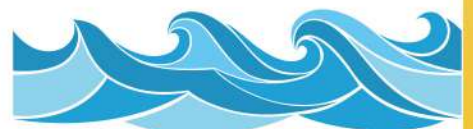
海 ㄏㄞˊ 洋 ㄩㄥˊ