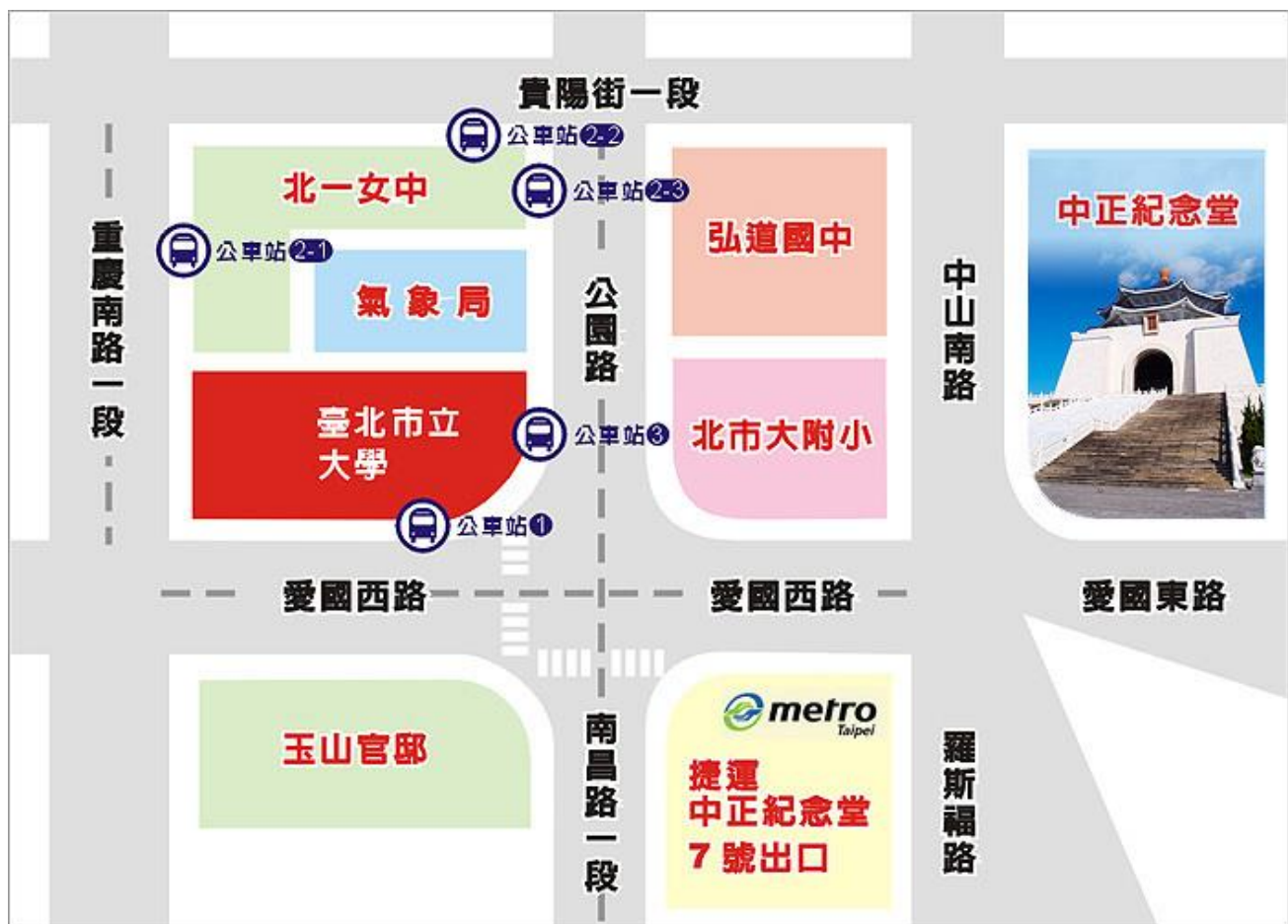
臺北市立大學（博愛校區）校園平面圖